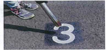
④バーナーで加熱し、溶着する。