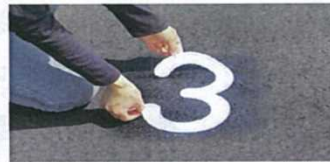
③バランスをみて、シートを置く。