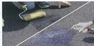
②プライマーを塗る。