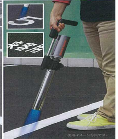
使用イメージ写真です。

「ロードマーキング」は駐車場などの路面に専用のシートを設置後、バーナーで加熱し溶着させる路面標示材です。DIY（自分）で簡単に強力に、比較的lowコストで「プロ並み」の路面標示施工ができます。