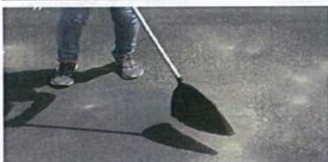
①シート設置面の清掃