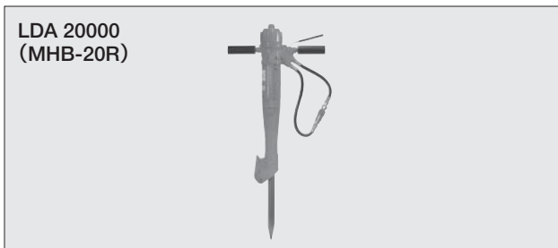
LDA 20000 (MHB-20R)